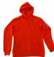
Hettgenser i økologisk bomull, leveres i dame og herrestørrelse 379 kroner *