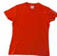
T-shirt i økologisk bomull, leveres i dame og herrestørrelse 149 kroner *