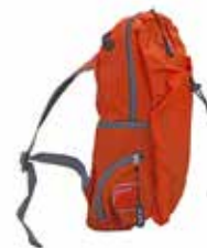
Liten sekk, 17 liter 185 kroner *