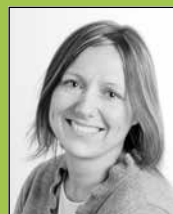
Guro Løkken Bæro Advokat

Har du spørsmål til juristene eller til forhandlingsavdelingen, kan du sende spørsmålene til trygve.bergsland@parat.com . Vi hjelper deg som medlem med alle typer problemstillinger knyttet til arbeidsforhold og tolkning av avtaleverket. Du kan også ta kontakt med oss når det er behov for skriftlig og muntlig rådgivning i forbindelse med omorganisering, nedbemanningsprosesser, ferie, arbeidstidsordninger, trygdespørsmål og lignende.