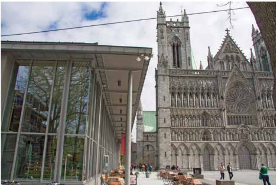
I besøksenteret er det kafé og suvenirbutikk som dekker både Nidaros domkirke og Erkebispegården. I 2016 ble det registrert til sammen 400 000 besøkende.

Hun er et eksempel på det internasjonale mangfoldet i virksomheten.