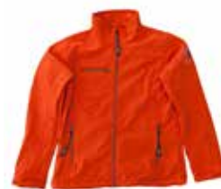
Skalljakke for vår og sommer. Vind- og vannavvisende i dame og herrestørrelse 555 kroner *

Fargen er oransje, som gir varme og som signaliserer glede, bevegelse og nytelse. Oransje virker oppløftende og den jager triste tanker på dør. Oransje stimulerer også til aktivitet, nysgjerrighet og kreativitet.