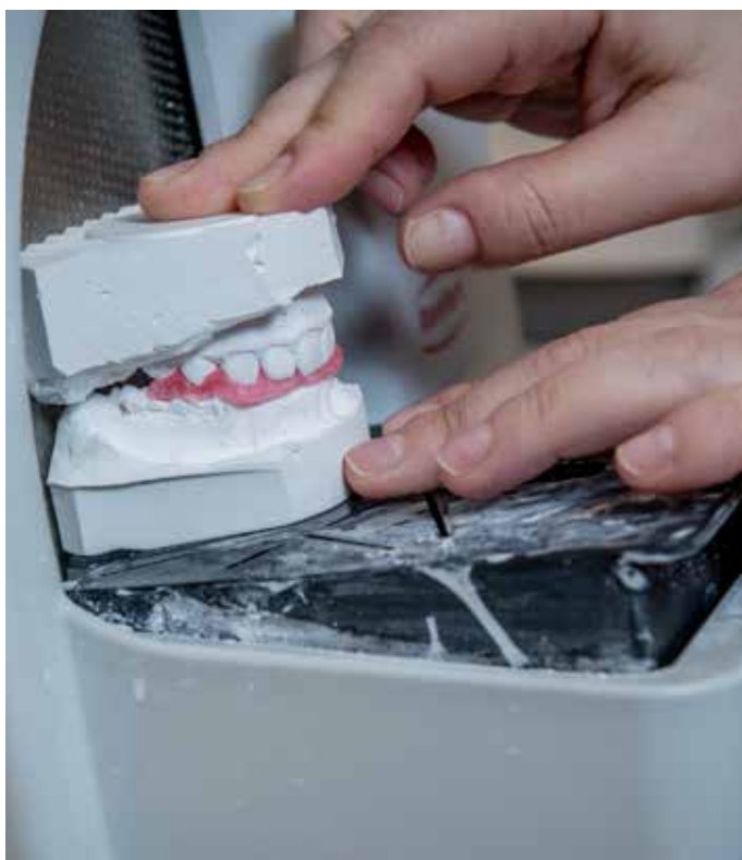
Rud klargjør en tannmodell på tannteknisk lab.