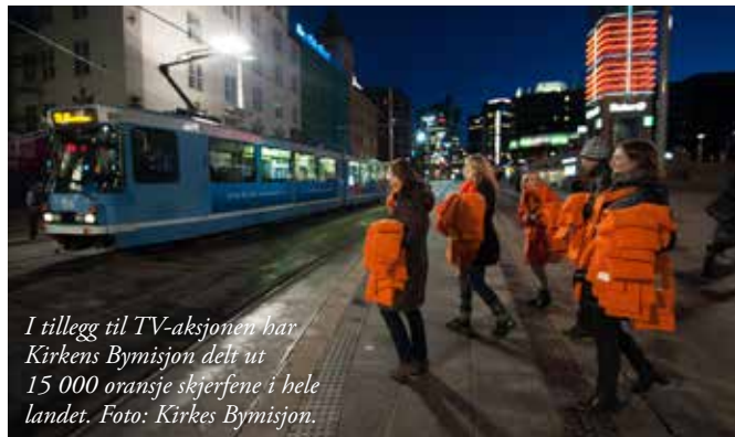
I tillegg til TV-aksjonen har Kirkes Bymisjon delt ut 15 000 oransje skjerfene i hele landet.

Det er mange måter å være utenfor på. Fra å mangle en seng å sove i, til å være utenfor arbeidsliv eller sosiale fellesskap. Dette rammer ikke bare enkeltpersoner, men gir ringvirkninger for hele befolkningen. Parat bidro med 40 000 kroner.