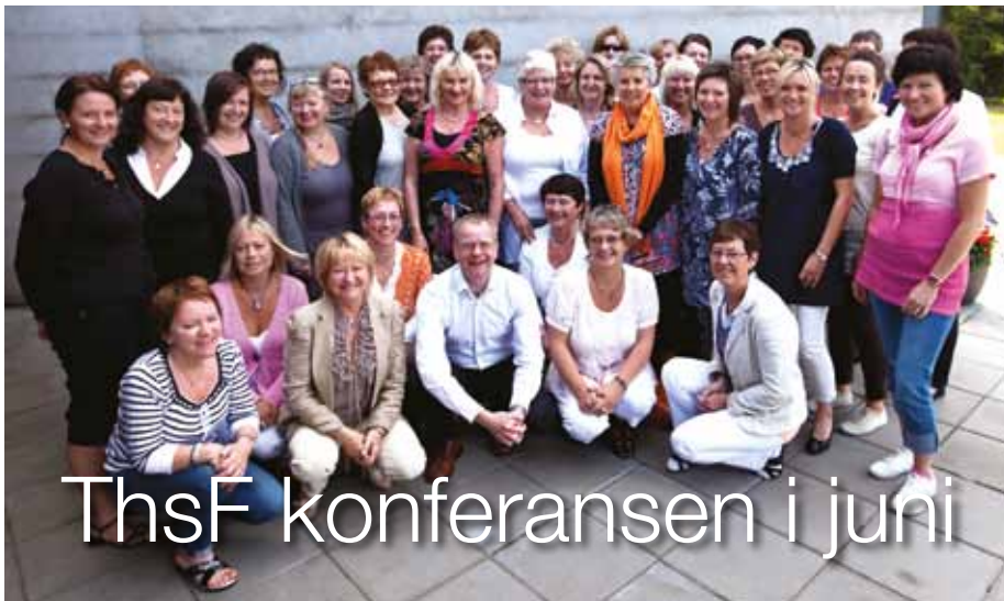
Hele kursgjengen på 36 deltagere samlet for felles fotografering